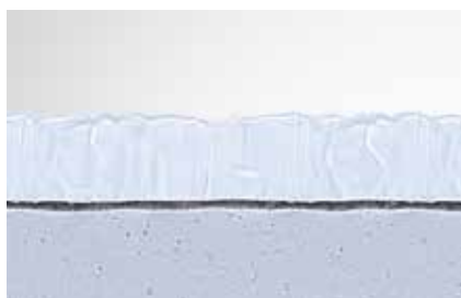
SpeediCath hydrofilt ytskikt