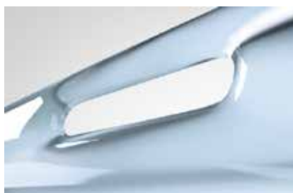
SpeediCath polerade kateterögon

SpeediCath® katetrar – Klar vätska utan risk för fläckar på textilier