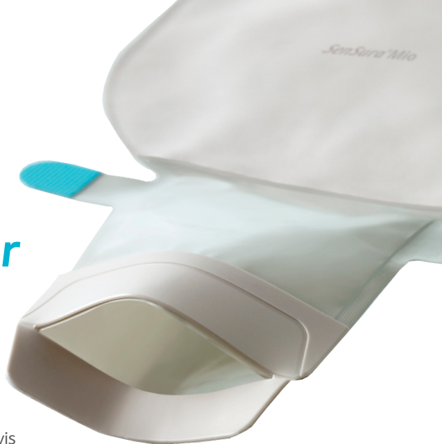
SenSura® Mio 1-delsbandage