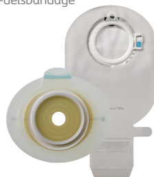
2-delsbandage med klickkoppling