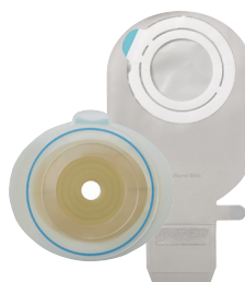
2-delsbandage med häftkoppling