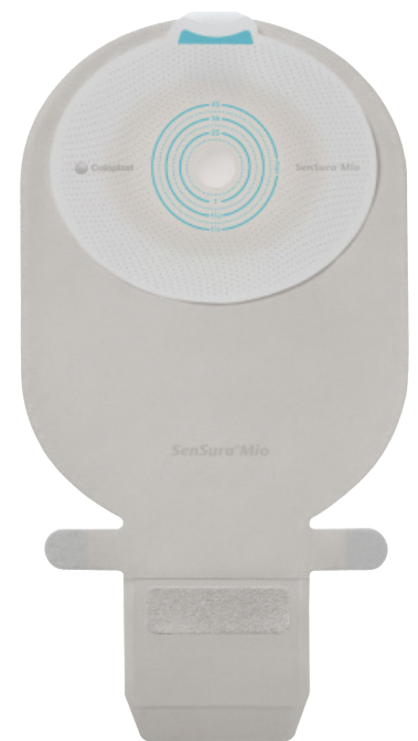
SenSura Mio 1-dels tömbar påse