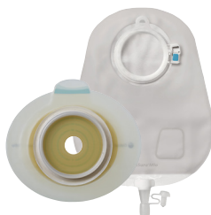
2-delsbandage med klickkoppling