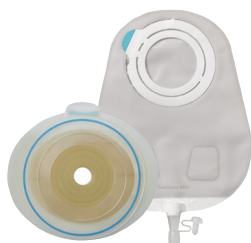
2-delsbandage med häftkoppling